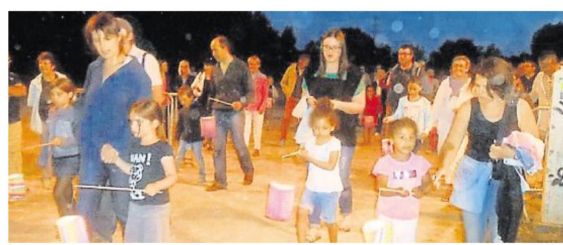
Départ des enfants pour la retraite aux flambeaux.

Lundi 13 juillet, la plaine de jeux accueillait les premiers arrivants pour la retraite aux flambeaux. Emmené par les formations l'Harmonie et la Renaissance, le cortège s'en est allée dans les rues de la commune pour rejoindre la coulée verte pour le feu d'artifice. Le lendemain, la matinée était consacrée à la revue des sapeurs-pompiers qui ont défilé jusqu'au monument aux morts. Ensuite place au repas républicain qui a réuni plus de 200 convives.