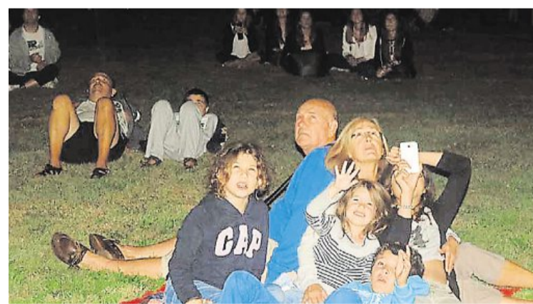
Les spectateurs étaient assis sur le terrain de la Terroirie pour admirer le feu d'artifice.

C'est sur des musiques des années 80 que les artificiers ont œuvré ce lundi 13 juillet à partir de 23 heures sur la zone de la Terroirie. Comme chaque année, beaucoup d'habitants et des personnes des communes aux alentours sont venus défiler dans les rues avec les lampions, au son de la musique de Loué. Les majorettes